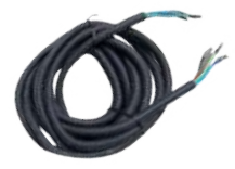
สายไฟขนาดยาว 4.3 เมตร