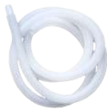
ท่อน้ำทิ้ง