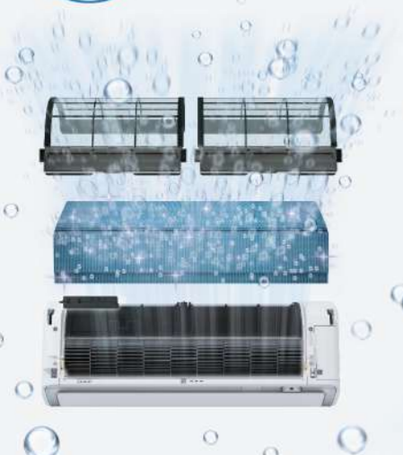
ล้างคอยล์เย็น

ระบบทำความสะอาดตัวเอง และเป่าลมไล่ความชื้น