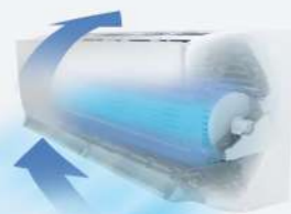
ระบบเป่าลมไล่ความชื้น