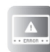
Error Code Display